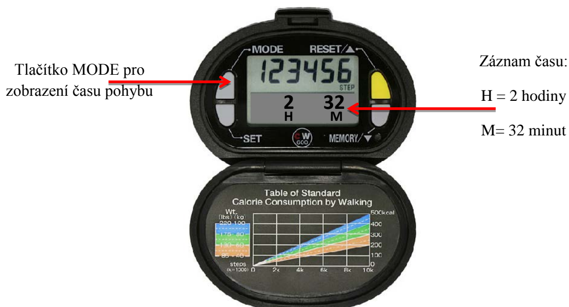
Obrázek 5. Záznam celkového času pohybu za den

Do tabulky také zaznamenáte dobu, po kterou byly vykonávány kroky, údaj opíšete z Vašeho krokoměru (obrázek 5). Tento údaj bude zobrazen při zmáčknutí tlačítka „MODE“ (vlevo nahoře). Nad písmenem „H“ bude zobrazen počet hodin, nad písmenem „M“ počet minut.