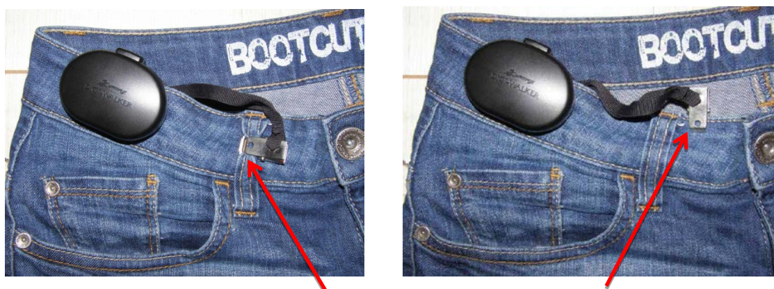
Obrázek 2. Upevnění krokoměru pomocí jisticího poutka

Otevření krokoměru: Uchopte krokoměr jednou rukou za sponu nahoře, zatímco druhou rukou zatlačte na vyčnívající část krytu. Vzniklý tlak mezi částí se sponou a částí s tělem krokoměru otevře kryt.