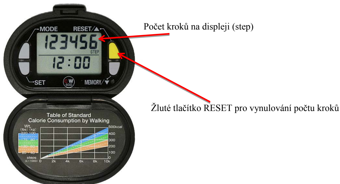
Obrázek 4. Krokoměr a počet kroků

nosit na sobě a večer před spaním jej sundáte a opíšete z něj hodnotu – počet kroků (obrázek 4) – do tabulky, kterou jste obdržel od Vašeho ošetřujícího lékaře.